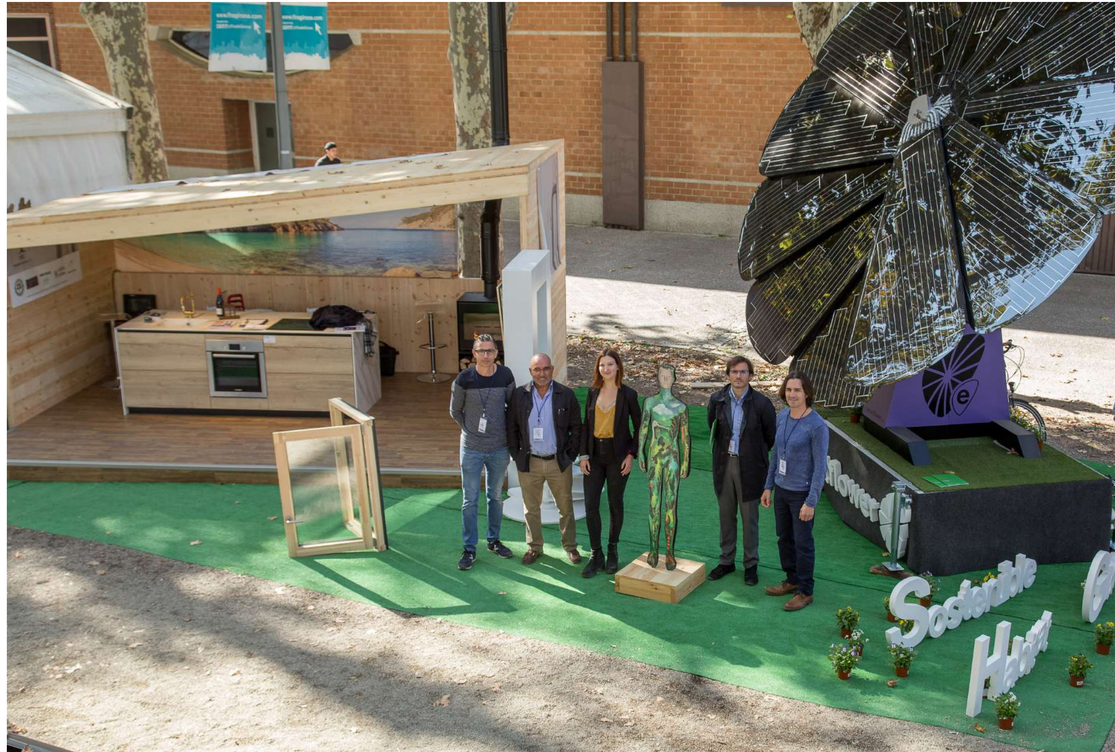
Protelec, Fustería Agustí i Fill, Llars de Foc Valls, Jordi Rubirola Jardinería

Els professionals que integrem Hàbitat Sostenible Girona som conscients de la responsabilitat amb el seu estalvi energètic i la cura de l'ambient.